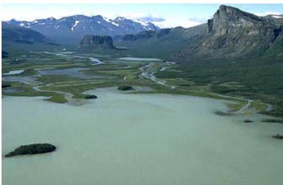
Laponia. Rapadeltat, Skierffe till höger i bilden.

Conseil International des Monuments et des Sites