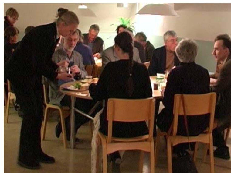
Gemensam buffé under takåsarna