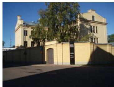
Departement i gammal stadsdel ger livlösa gaturnum

I mitt inlägg redogjorde jag förutom för tankesmedjan och för behovet av denna också för hur jag skulle vilja formulera motsvarande artikel 5 i dag. Självklart kan texten behöva bearbetas innan ett "Svenskt Venice Charter" beslutas. Den texten som jag presenterade på seminariet var något ändrad: