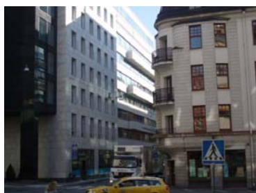
Liksom än mer vandrarhem i nedlagt fångelse