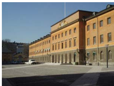
Administration ger visst tillräde. Kanske också skonsam förändring

För detta krävs att vi först själva formulerar oss om förhållningssätt, inriktning och mål med vårt arbete så att vi har ett välgrundat budskap att utgå ifrån. ICOMOS SWEDEN:s styrelse har bestämt att det är lämpligt att utgå från "Venice Charter". Det är dock inte helt relevant i dag och gäller inte så tydligt svenska förhållanden, varför det behöver utvecklas. I seminariet "Värde och bruk" diskuterades "Venice Charter" Artikel 5.