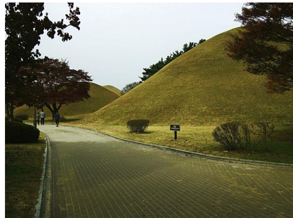
Daereungwon Ancient Tomb Complex