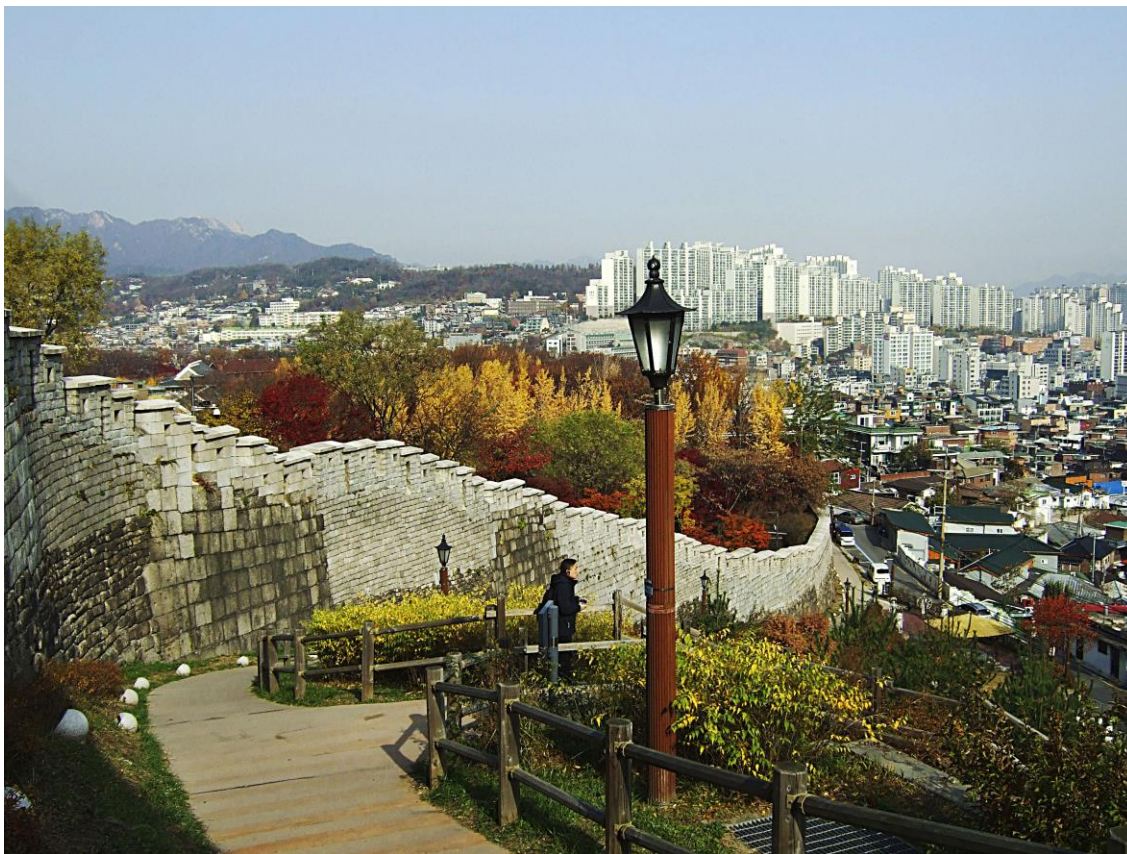
Utsidan av stadsmuren i Seoul med spår av olika utbyggnadsskeden.

Stora delar revs under 1900-talets början men från 1960-talet och framåt har omfattande konserveringsarbeten pågått. Idag är omkring två tredjedelar av muren eller 12,5 km bevarade. Flera ståtliga stadsportar har restaurerats eller rekonstruerats och hela muren rustats upp och gjorts mer tillgänglig för besökare. Den är nu nominerad till världsarvslistan.