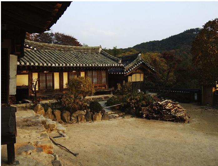
Klanhus i Yangdong Historic Village

De två dagarnas studieresa innehöll världsarven Yangdong Historic Village, en klanby med rötter i 1300-talet, med träbyggnader i sluttningarna ner mot en dalgång, levande jordbruk och konfucianskt tänkande, Seokguram Grotto med en väldig Buddhastaty högt uppe i bergen och det buddistiska tempelkomplexet Bulguksa. Vi såg också flera nationella kulturmiljöer, bland annat Cheomseongdae Observatory, ett runt stentorn som är det äldsta astronomiska observatoriet i Asien, och det imponerande Daereungwon Ancient Tomb Complex med cirka 150 gravar och många mycket stora gravhögar.