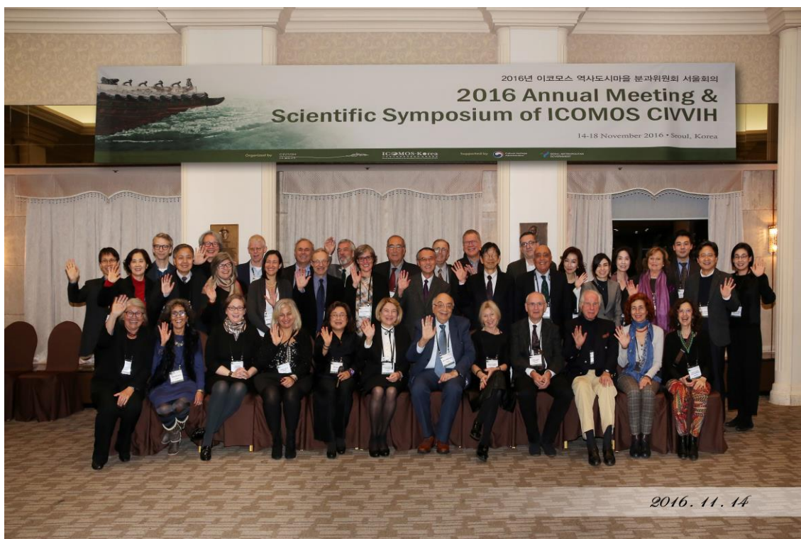
Deltagarna i det årliga mötet med Historic Towns-kommittén.